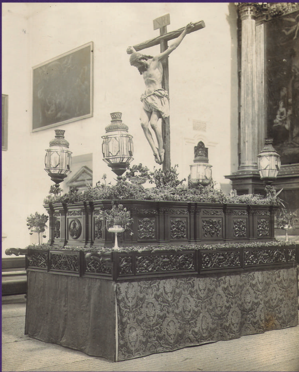
El paso del Santísimo Cristo de la Buena Muerte en la Iglesia de la Anunciación, en la Semana Santa de 1926