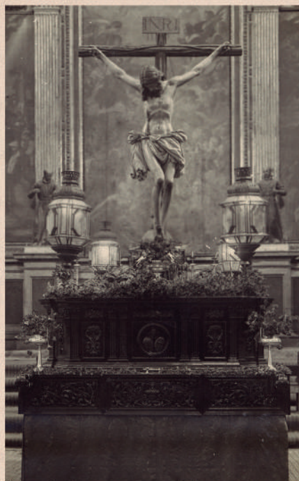
El paso de Cristo en su primera salida, en 1926

La Junta de Gobierno informa a todos los hermanos que, en cabildo de oficiales celebrado el pasado 9 de noviembre de 2025, se ha adoptado el acuerdo de que el Santísimo Cristo de la Buena Muerte realice Estación de Penitencia el próximo Martes Santo sobre su paso actual. Esta decisión se toma, en primer lugar, porque en el año 2026 conmemoramos el centenario de la primera salida procesional de la Hermandad, realizada con gran esfuerzo por nuestros hermanos fundadores, precisamente sobre el paso que ha acompañado a todas las generaciones de hermanos; entendemos que, con motivo de tan significativa efeméride, es especialmente apropiado que nuestro Titular vuelva a procesionar tal como lo hizo en aquel histórico Martes Santo de 1926. En segundo lugar y en relación al proyecto de nuevo paso procesional hemos de informar que el mismo aún no está finalizado y la Junta de Gobierno considera necesario actuar con prudencia, sin apresurar plazos y dando a una obra de esta relevancia el tiempo y el rigor técnico y artístico que merece.