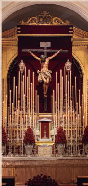
Altar de Quinario / MANUEL FDEZ. RANDO